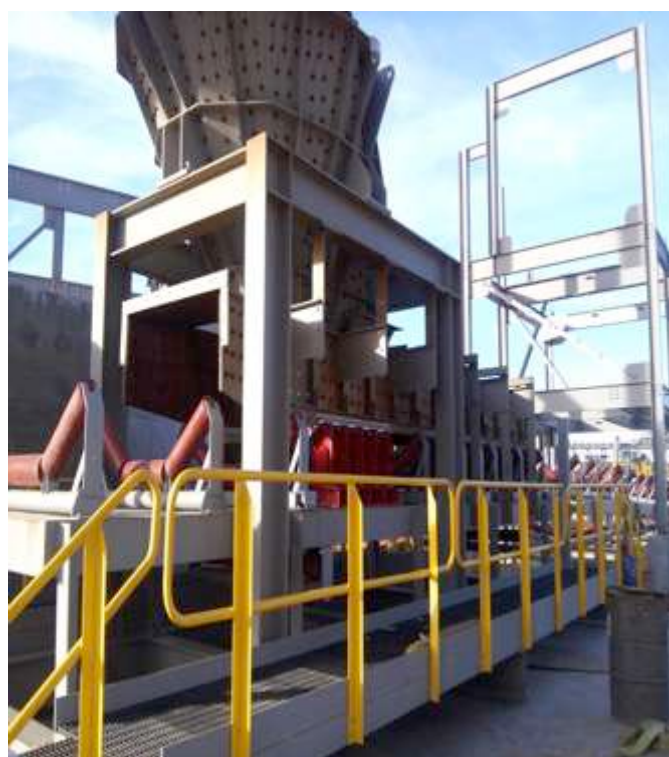
MONTAJE DE CHUTE DE DESCARGA DEL TRANSPORTADOR 214-CV-405