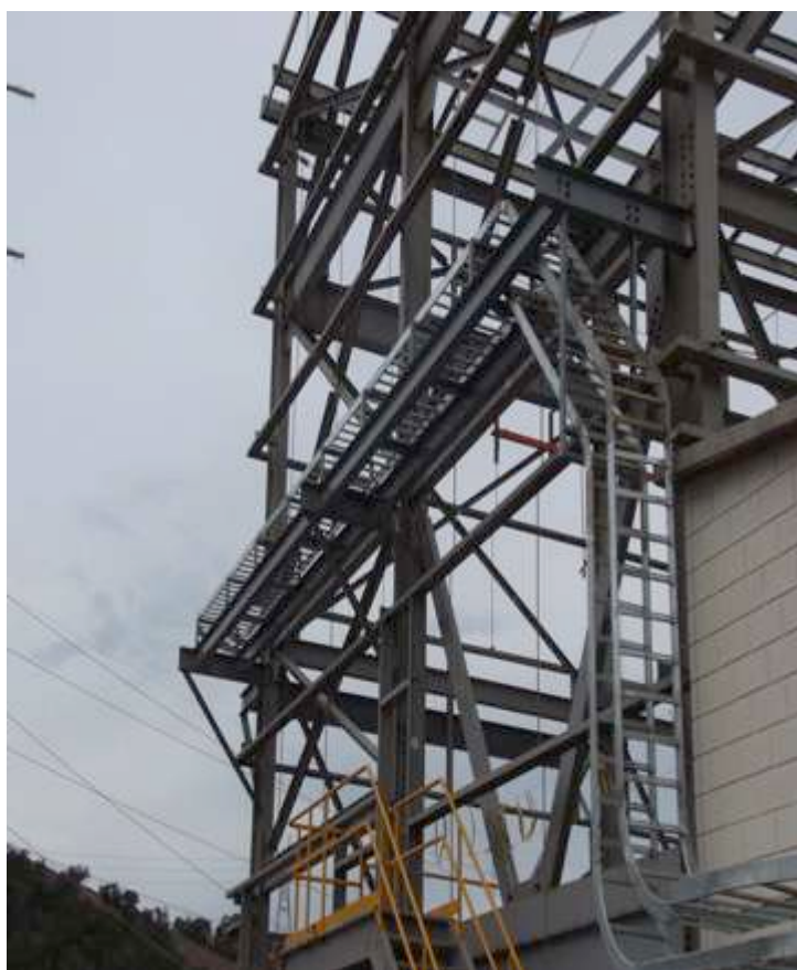
Montaje de estructura, envoltorio laminado, montaje electromecánico en área de filtros y almacén de concentrado.