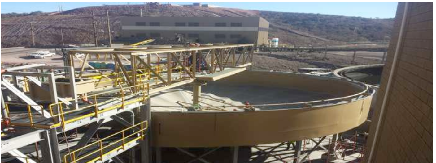
Vista interior de espesador de molibdeno