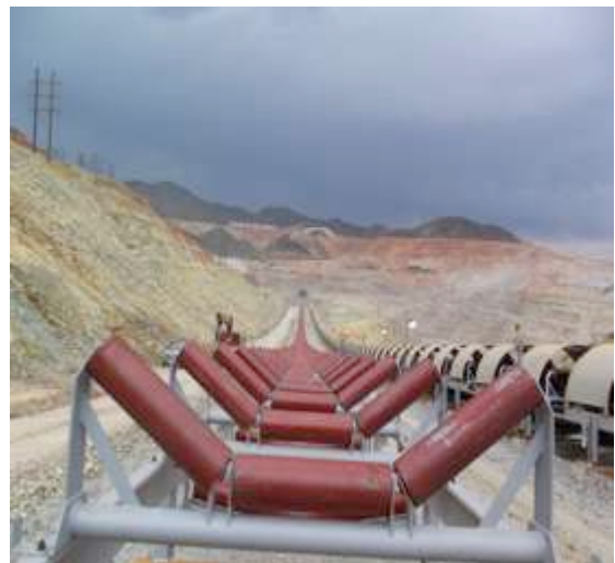
Montaje de mesas de impacto del transportador