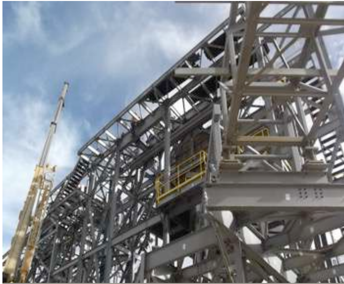
MONTAJE DE ESTRUCTURA METALICA EN TORRE DE TRANSFERENCIA 214-CV-403 A 404