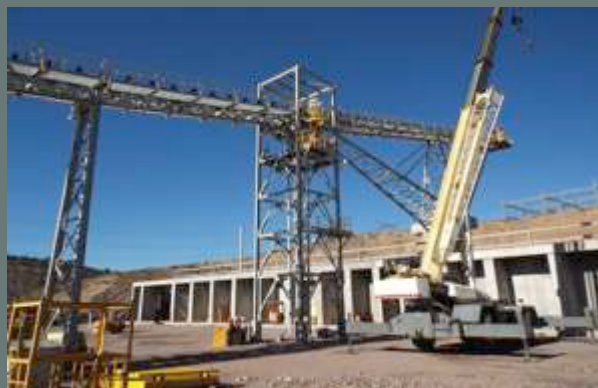
Banda Transportadora de Almacén.