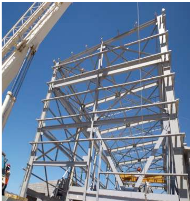
Filtros y Almacén de Concentrado.