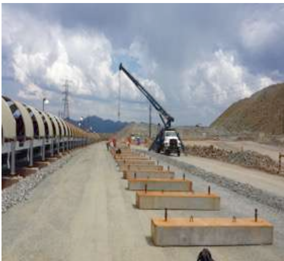
Montaje de bases para Quebalix IV

Lixiviación cuenta con un área de 250 hectáreas, divididas en 120 secciones de riego, y cuenta con una capacidad de bombeo de 1,000,000 mts 3 /Diarios.