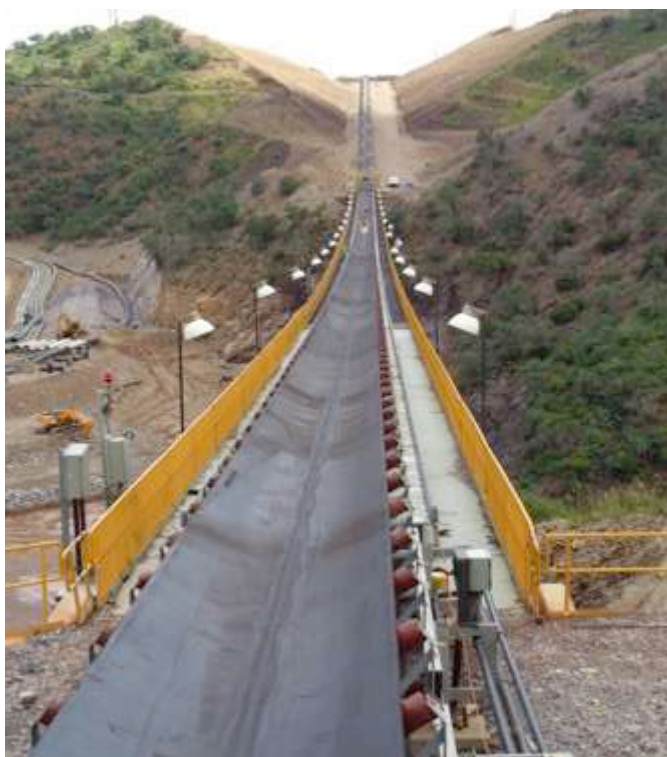
MONTAJE DE BANDA TRANSPORTADORA 214-CV-402