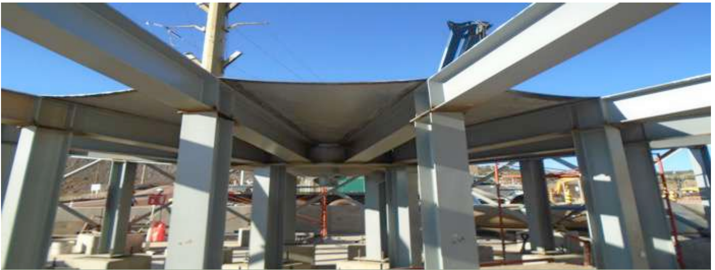
Armado y conformado de tanque espesador.