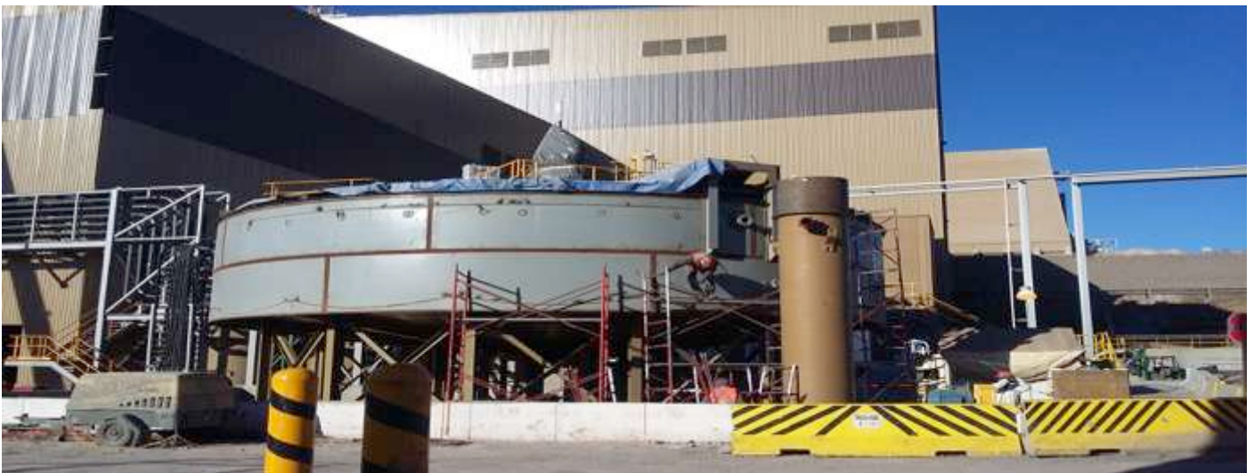
Espesador de molibdeno, preparación para pintura.