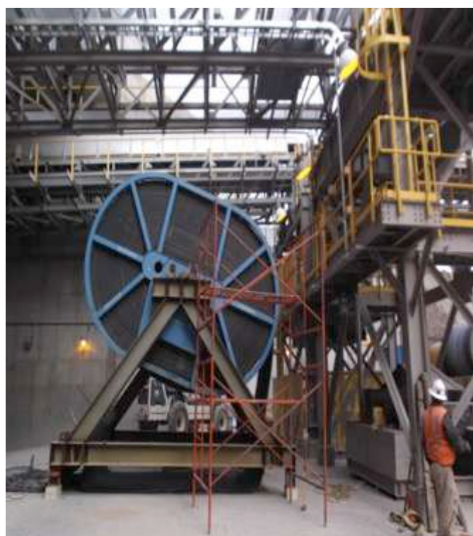
MONTAJE DE BANDA TRANSPORTADORA 214-CV-402