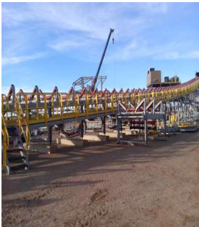
MONTAJE DE MESAS DE IMPACTO DEL TRANSPORTADOR 214-CV-405